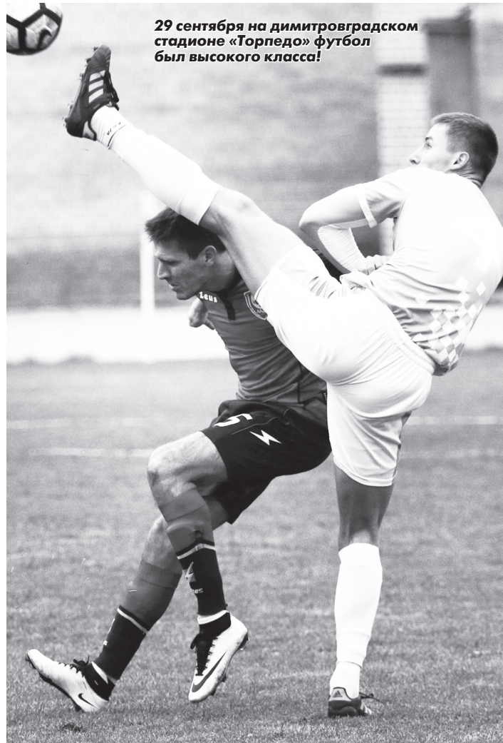
29 сентября на димитровградском стадионе «Торпедо» футбол был высокого класса!

После перерыва хозяева стали действовать более увереннее на чужой половине поля, сделали несколько хороших подходов к воротам соперника. Вурнарцы создавали напряжение через контратаки и угловые. Однако и тем и другим для гола не хватало качественного завершения.