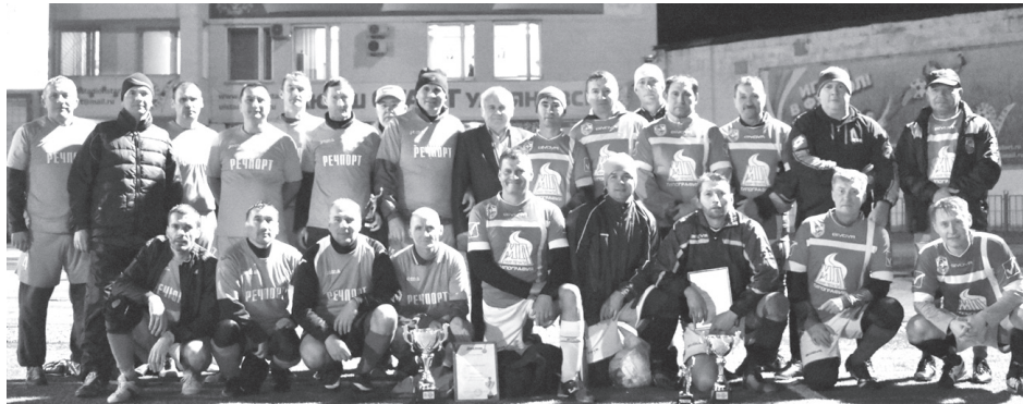
Финалисты Кубка Ульяновска-2018 - команды «Речпорт» и «Север-Димитровград».